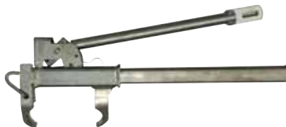
№ 50 Монтажные щипцы для сборки цепей