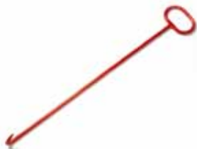
№ 58 Крюк для перемещения цепи