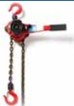
№ 49 Рычажная лебедка для монтажа и натяжения тяжелых цепей