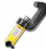
№ 53 Набор гидравлического инструмента